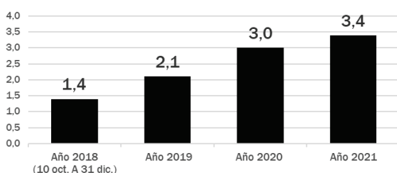
Evolución anual de À Punt