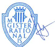
Vicent Cucarella Tormo